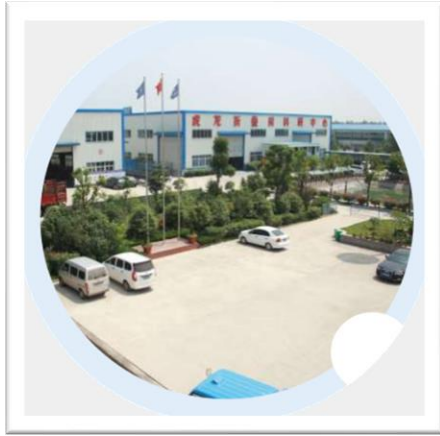
※ 中国生産工場 ※